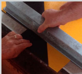
Procéder aux ajustements en découpant les bandes PREMARK™