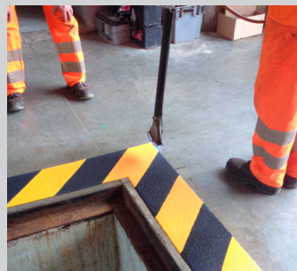
Chauffer PREMARK™ Chalumeau préconisé : JETPACK