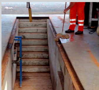
Nettoyer et dégraisser la zone à équiper

Afin de prévenir le risque de chute de hauteur dans les fosses de visite, il est recommandé de baliser le pourtour de la fosse notamment en la délimitant par des bandes de couleur alternées contrastées et antidérapantes (jaune et noires).