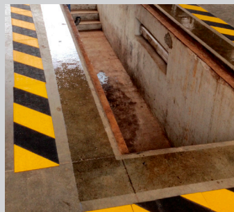
Appliquer le primaire Vixi™ sur support béton